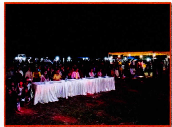
กิจกรรมการประกวดนางนพมาศ