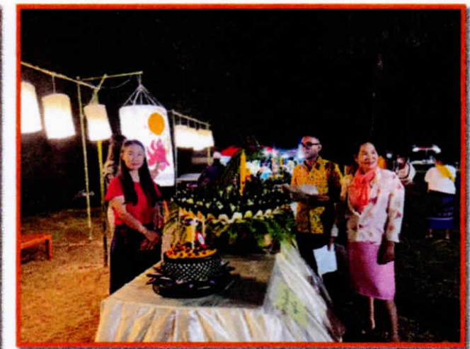
กิจกรรมการประกวดกระถางสวยงาม